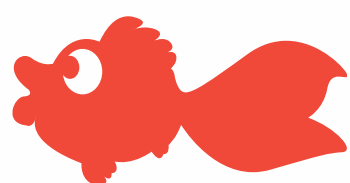
Poisson Haut. 430 x 850 mm