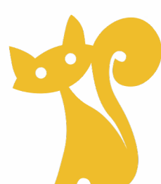
Chat Haut. 550 x 495 mm