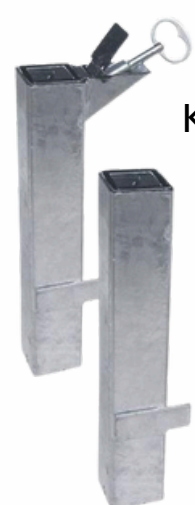
Kit d'amovibilité Serrubloc Réf 10031