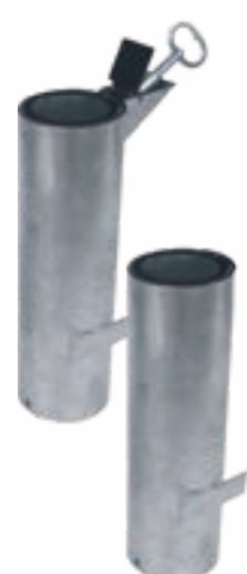
Province, Trio, Linea et Carrefour