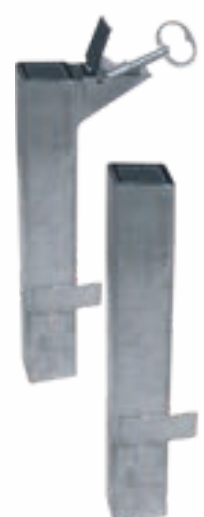
Lisbonne et Héritage