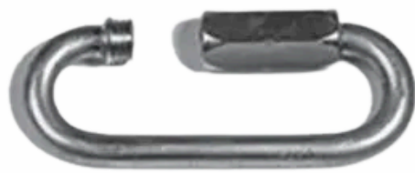
Ø 5 x 13,5 x 51 mm Réf. 10036-01