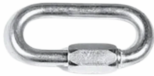
Ø 12 x 24 x 80 mm Réf. 10036-21