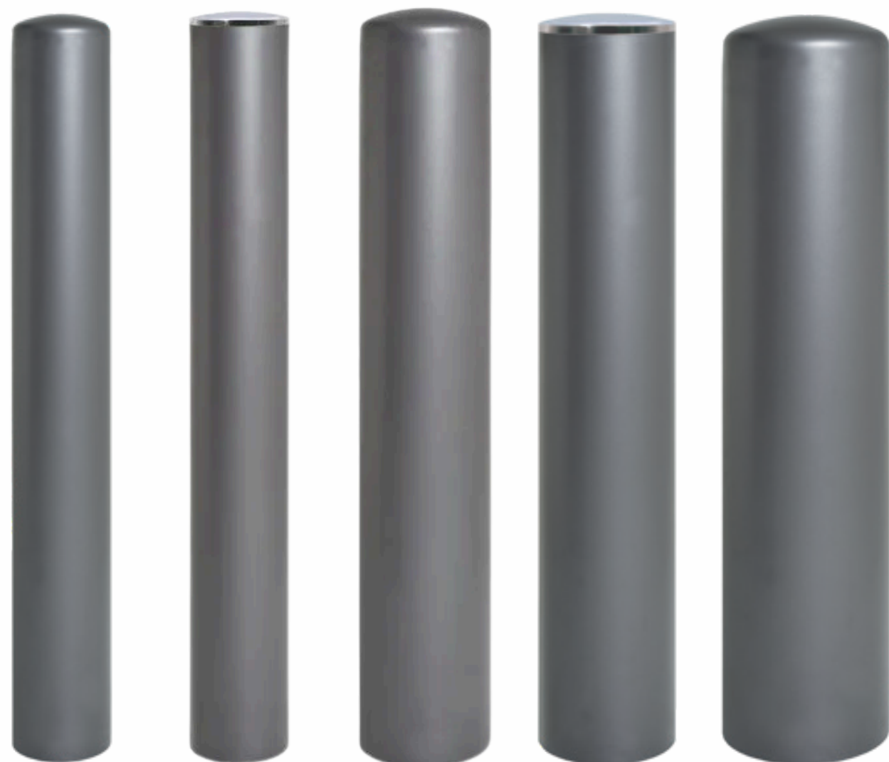
Réf.10346-001 Ø 160 mm Réf.10347-01 Ø 160 mm Réf.10346-021 Ø 219 mm Réf.10347-21 Ø 219 mm Réf.10346-041 Ø 273 mm