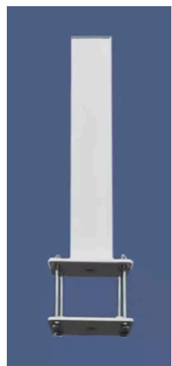
Kit de fixation pour panneau Réf. 10306