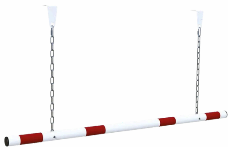
Bavette limiteur hauteur Réf. 10308