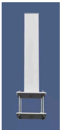
Kit de fixation pour panneau Réf. 10306