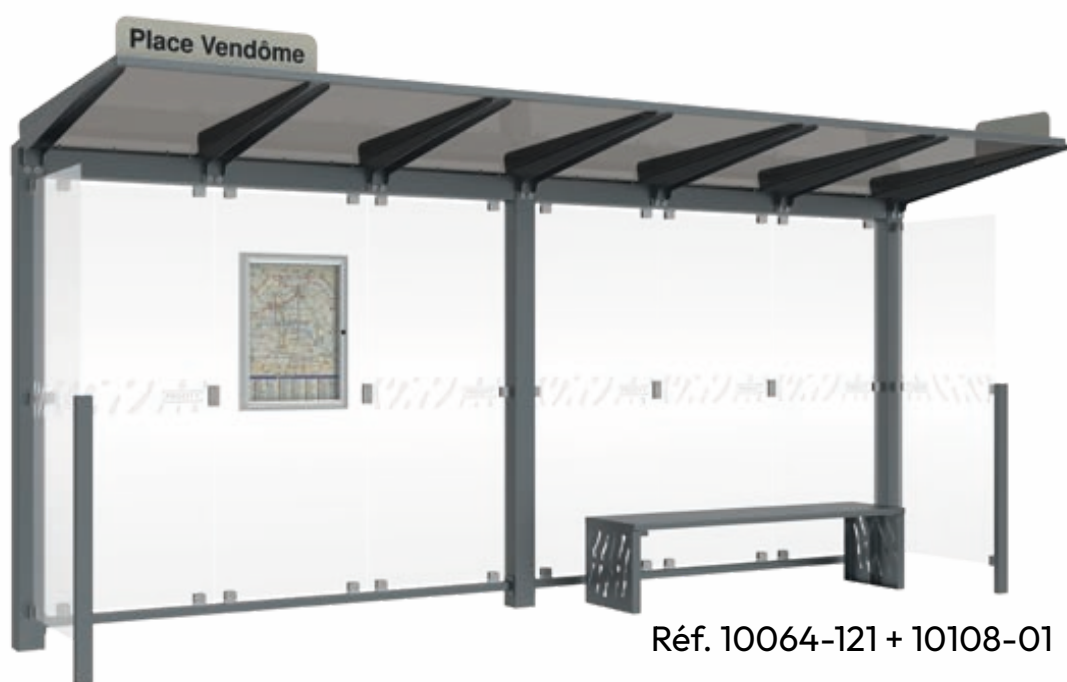
Réf. 10064-121 + 10108-01