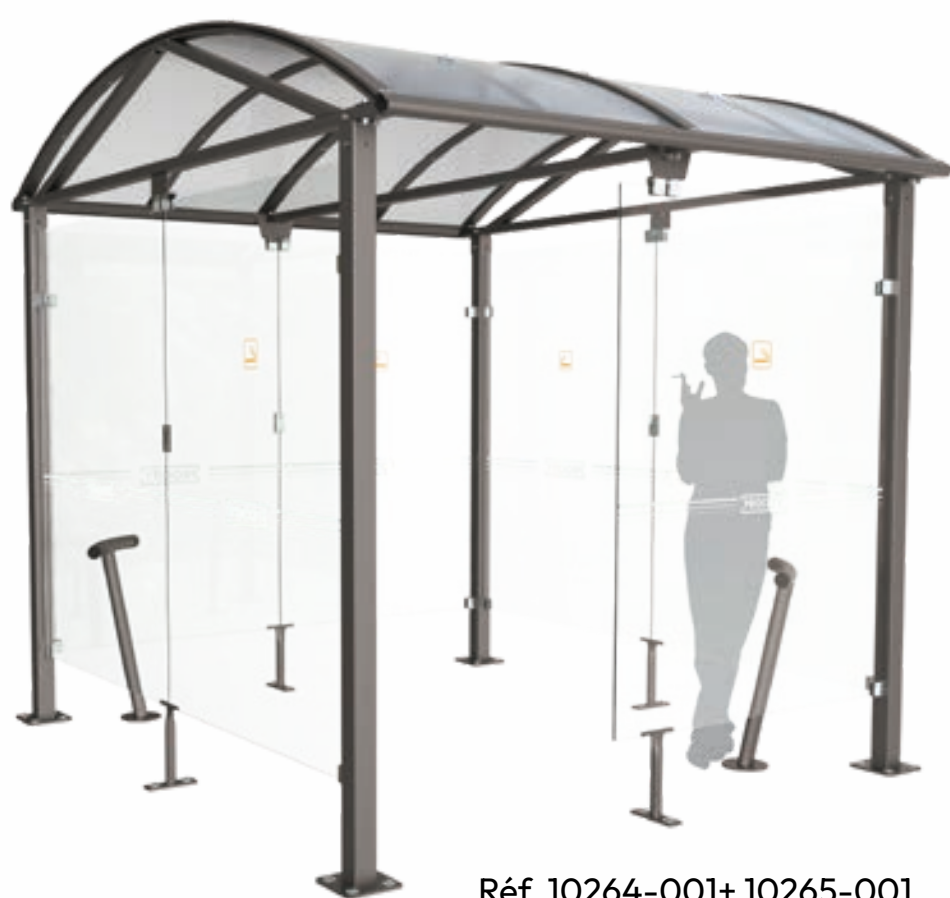
Réf. 10264-001+ 10265-001